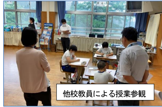
他校教員による授業参観

6月12日(金)、霧島市内の複式学級がある小学校の教員が集まって、複式指導の在り方を考える研究会が本校で開催されました(本校職員を含む50人ほどが参加、会場校は輪番で毎年開催)。授業を参観してもらったり、各学校の現状を踏まえた情報交換をしたりしました。通常であれば一つの学級だけを参観してもらうものですが、本校ではすべての教員の指導力アップを目指しているので、すべての学級の授業を公開して参観してもらいました。外部参加者からは、指導力向上・学力向上に向けた学校全体の雰囲気や意欲に対してお褒めの言葉をたくさんいただきました。