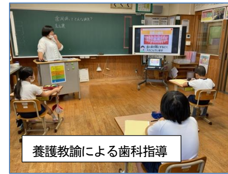
養護教諭による歯科指導

果では、永久歯のう歯や歯肉炎も目立ってきています。定期的にお子さんの口の中を覗いたり歯磨きの様子を確認したりしてみてください。ご家庭でのかかわりで「自分の歯を一生大事にしよう」とする高い意識を子供のうちに持たせたいものです。